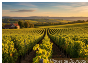
Vignes de Bourgogne

J4. Château de Vaux / Votre région : Visite commentée de l'élégant Château de Vaux. Entouré de verdure, il date du 18 ème siècle et se distingue par son architecture classique et ses jardins à la française. Route du retour pour votre région. Arrivée chez vous en fin de soirée.