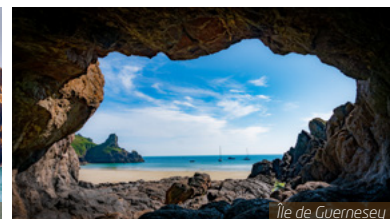
Île de Guernesey