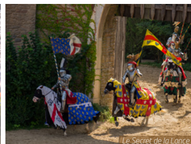
Le Secret de la Lance