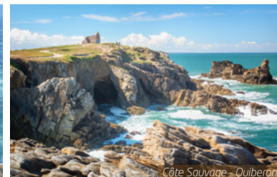
Côte Sauvage - Quiberon