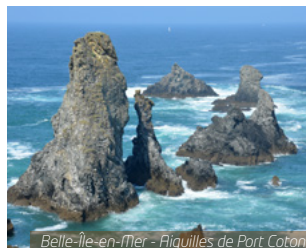
Belle-Île-en-Mer - Aiguilles de Port-Coton

J4. Quiberon / Votre région : Départ vers Quiberon. Découverte de la Côte Sauvage, de Portivy à Port Maria. À l'est, la Presqu'île est bordée par un plan d'eau exceptionnel : la baie de Quiberon. À l'ouest, le paysage magnifique de la Côte Sauvage est une invitation aux promenades. Visite de la conserverie « la Belle-Îloise », qui vous fera revivre la grande épopée de la pêche au thon et à la sardine. Route du retour pour votre région. Arrivée chez vous en fin de journée.