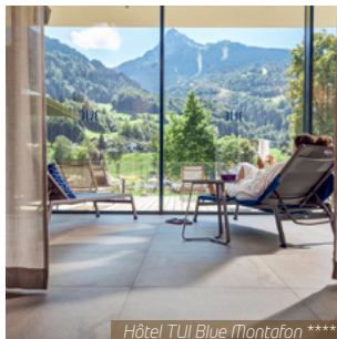
Hôtel TUI Blue Montafon ****

J5. Tschagguns / Votre région : Départ pour la route du retour. Arrivée chez vous en fin de soirée.