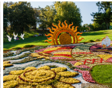
Île de Mainau