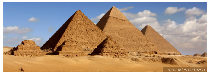
Pyramides de Gizeh

J4. Assouan / Philae : Dernière grande ville du sud de la Haute-Égypte, Assouan se trouve aux portes du désert. Entre les Îles Éléphantines et les dunes de sable, vous serez charmé par le site et ses souks hauts en couleur. Balade en felouque à Assouan. Arrêt photo au Haut Barrage. Puis, visite de la « Perle du Nil », le Temple de Philae, lui aussi sauvé des eaux. En soirée, laissez-vous tenter par une promenade dans les rues sinueuses des souks pour ramener quelques souvenirs ou des épices aux senteurs enivrantes. En option et avec supplément : possibilité d'assister au spectacle Son et Lumière du Temple de Philae.