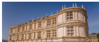
Château de Grignan

J4. Lyon / Vichy / Votre région : Débarquement et départ pour Vichy. Découverte de la ville en petit train. Route du retour et arrivée chez vous en fin de journée.