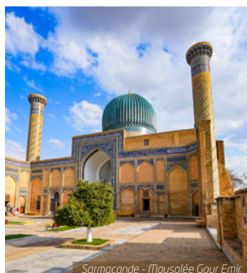
Samarcande - Mausolée Gour Emir