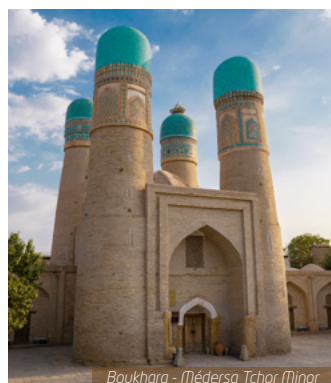
Boukhara - Médersa Tchour Minor

J11. Ourgouentch / Paris / Votre région : Petit-déjeuner sous forme de box. Transfert à l'aéroport et vol retour avec escale pour la France. Atterrissage à Paris et transfert pour votre région (en fonction des horaires de vol, l'arrivée chez vous peut être tôt le lendemain matin).