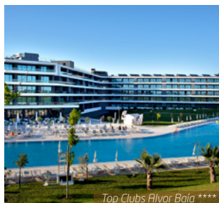
Top Clubs Alvor Baía ****

J8. Faro / Aéroport de Limoges : Transfert à l'aéroport de Faro et vol retour à destination de l'aéroport de Limoges.