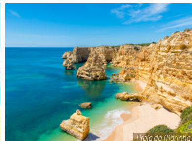
Praia da Marinha