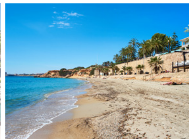
Playa de Punta Prima