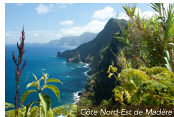
Côte Nord-Est de Madère