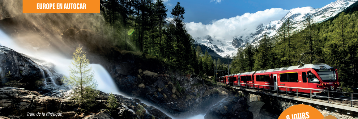
Train de la Rhétique