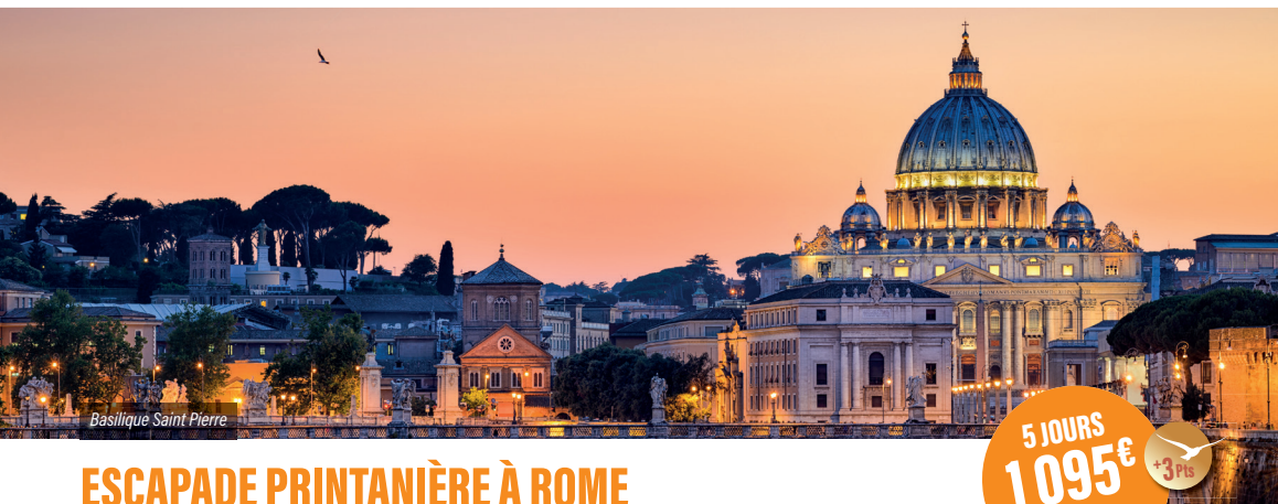
Basilique Saint Pierre