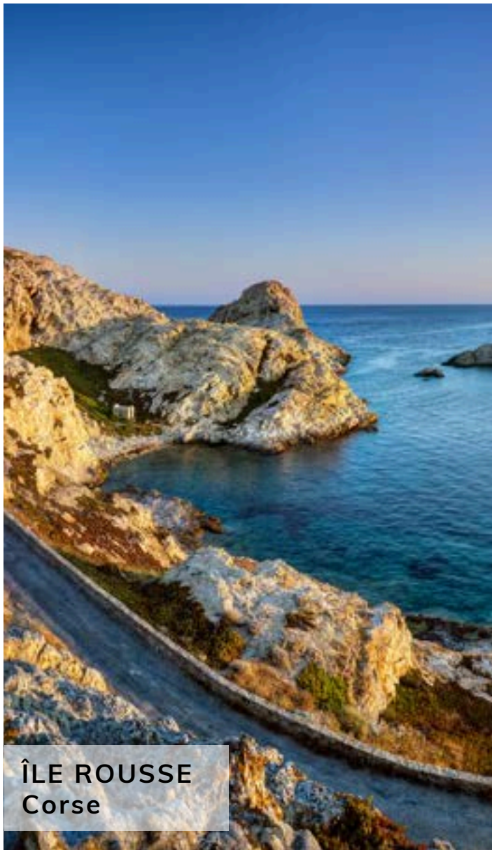
ÎLE ROUSSE Corse