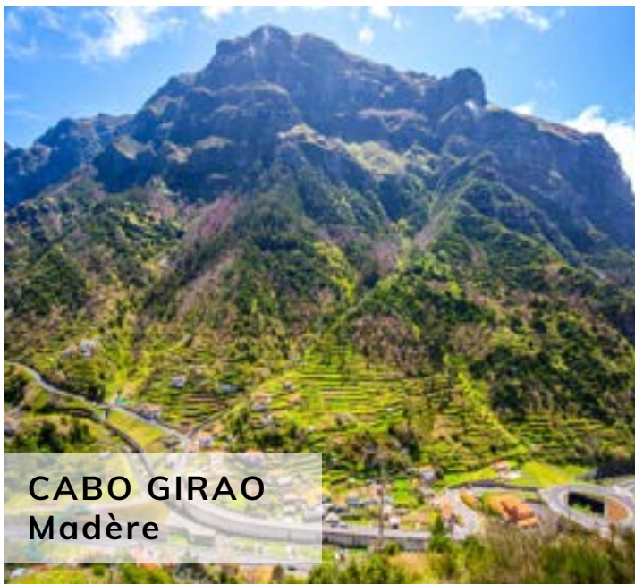
CABO GIRAO Madère