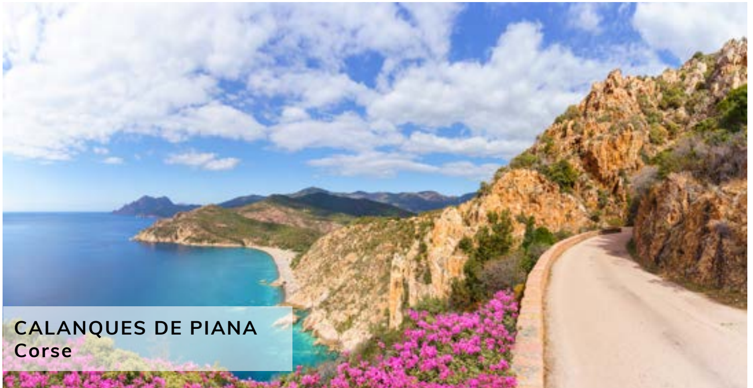
CALANQUES DE PIANA Corse