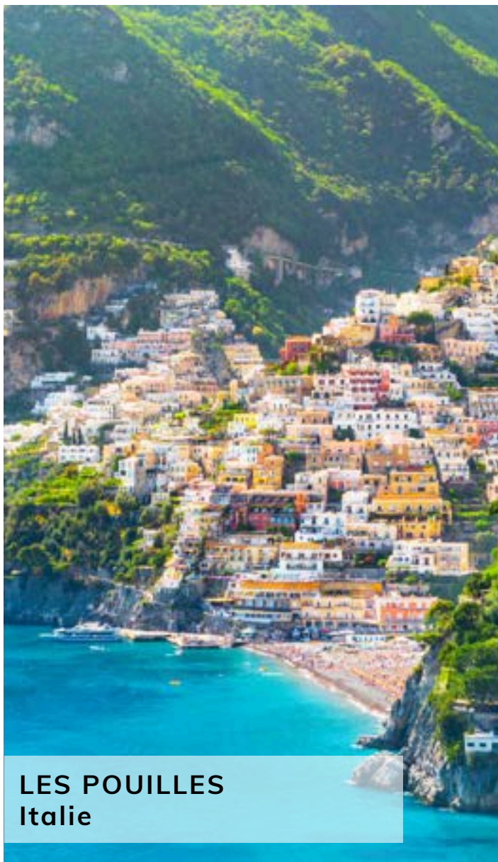
LES POUILLES Italie