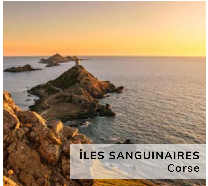
ÎLES SANGUINAIRES Corse