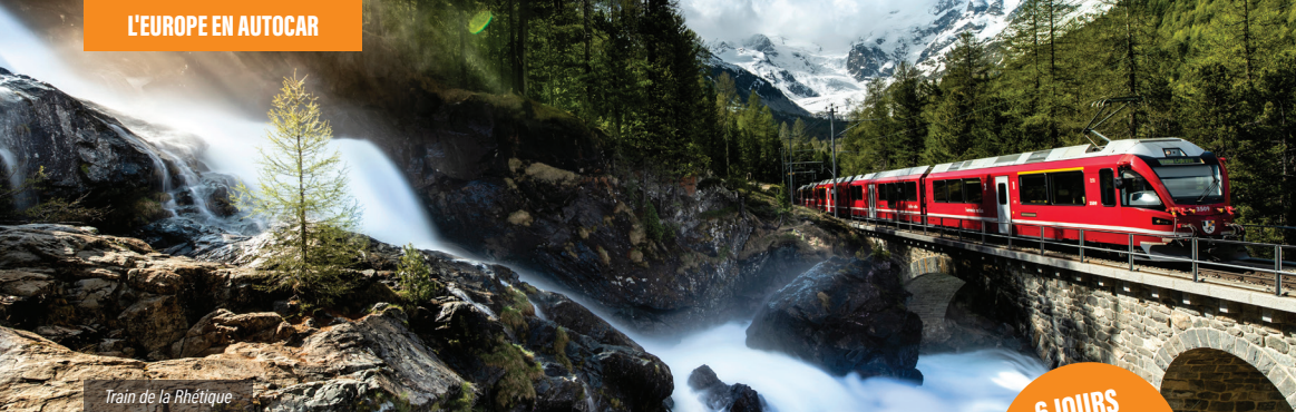
Train de la Rhétique