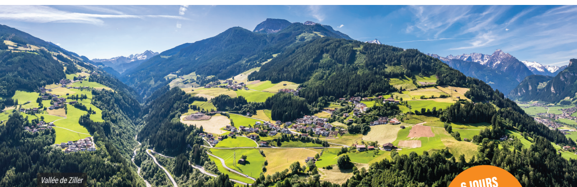
Vallée de Ziller