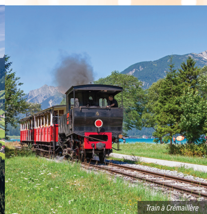
Train à Crémaillère