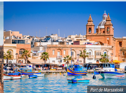
Port de Marsaxlokk