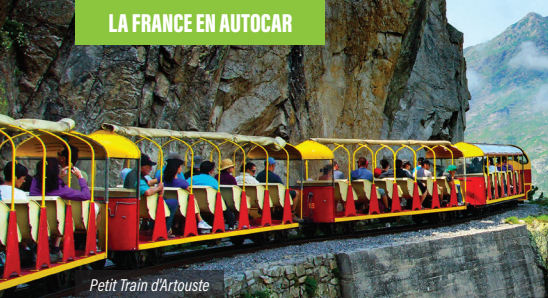
Petit Train d'Artouste