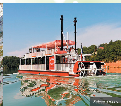
Bateau à roue