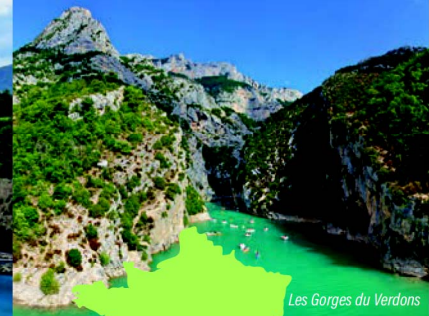
Les Gorges du Verdon