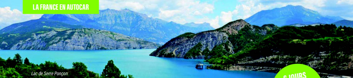
Lac de Serre Ponçon