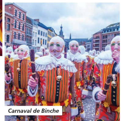
Carnaval de Binche

Tarif par personne comprenant : le transport en autocar de Grand Tourisme, l'hébergement en hôtels 2*, la pension complète du petit-déjeuner du jour 1 au déjeuner du jour 5 (excepté le déjeuner du jour 2 et le dîner du jour 4), les boissons aux repas, les visites et excursions prévues au programme, l'assurance assistance-rapatriement.