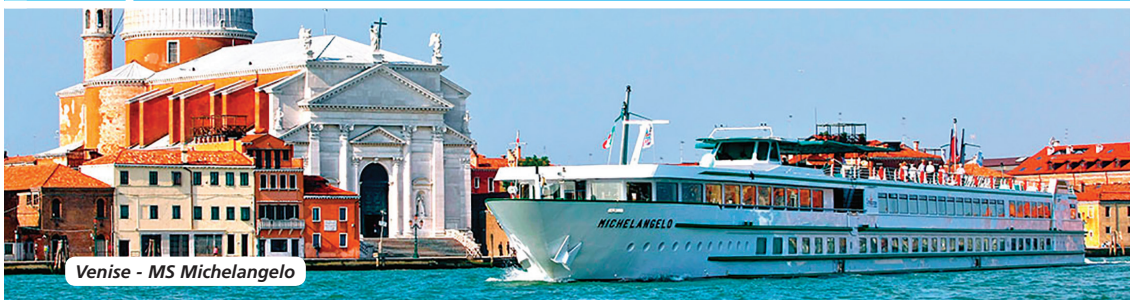
Venise - MS Michelangelo

👍 FORMULE BOISSONS « ALL INCLUSIVE » À BORD DU BATEAU