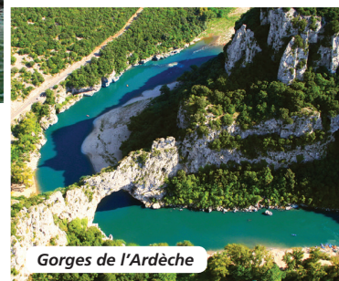
Gorges de l'Ardèche

Tarif par personne comprenant : le transport en autocar de Grand Tourisme, l'hébergement à bord du MS Van Gogh II (bateau 5 ancres de la compagnie CroisiEurope) les nuits des jours 2 à 4, la nuit en hôtel 3* le jour 1, la pension complète, boissons incluses, du petit-déjeuner du jour 1 au déjeuner du jour 5, la formule boissons « All Inclusive » à bord du bateau, les visites et excursions prévues au programme, l'assurance assistance-rapatriement.