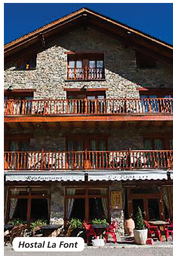
Hostal La Font

vos région et arrivée chez vous en soirée.