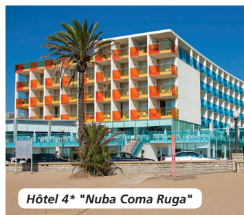
Hôtel 4* "Nuba Coma Ruga"

Ne comprenant pas : l'excursion facultative à Port Aventura, le supplément chambre individuelle : + 75 €, l'assurance annulation : + 30 € par personne.