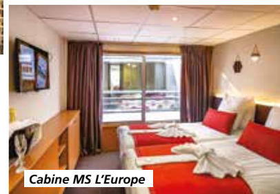
Cabine MS L'Europe

Tarif par personne comprenant : le transport en autocar de Grand Tourisme pour Strasbourg A/R, le vol retour entre Budapest et Strasbourg, l'hébergement à bord du MS L'Europe (bateau 4 ancres) de la compagnie CroisiEurope, la pension complète du déjeuner du jour 1 au petit-déjeuner du jour 7, boissons comprises, les visites et excursions prévues au programme, l'animation à bord en soirée, l'assurance rapatriement.