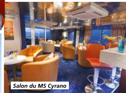
Salon du MS Cyrano

Tarif par personne comprenant : le transport en autocar de Grand Tourisme, l'hébergement à bord du MS Cyrano de Bergerac (bateau 5 ancres) de la compagnie CroisiEurope, la pension complète du déjeuner du jour 1 au déjeuner du jour 5, boissons comprises, les visites et excursions prévues au programme, l'assurance rapatriement.