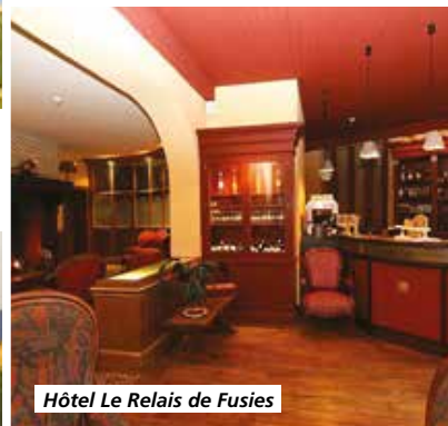
Hôtel Le Relais de Fusies

Tarif par personne comprenant : le transport en autocar de Grand Tourisme, l'hébergement en hôtel 3*, la pension complète du petit-déjeuner du jour 1 au déjeuner du jour 5, boissons comprises, les visites et excursions prévues au programme, l'assurance rapatriement.