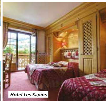
Hôtel Les Sapins

Tarif par personne comprenant : le transport en autocar de Grand Tourisme, l'hébergement en hôtel 4*, la pension complète du petit-déjeuner du jour 1 au déjeuner du jour 5, boissons comprises, les visites et excursions prévues au programme, l'assurance rapatriement.