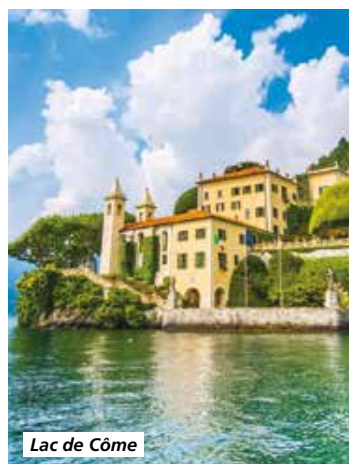
Lac de Côme

Départ pour la France par l'autoroute. Arrêt déjeuner en cours de route. Poursuite pour votre région et arrivée chez vous en soirée.