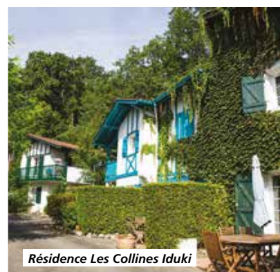
Résidence Les Collines Iduki

Matinée libre à la Résidence de Tourisme. Déjeuner. Route du retour pour votre région. Arrivée chez vous en soirée.