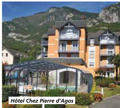
Hôtel Chez Pierre d'Agos

Tarif par personne comprenant : le transport en autocar de Grand Tourisme, l'hébergement en hôtel 3*, la pension complète du petit-déjeuner du jour 1 au déjeuner du jour 6, boissons comprises, les visites et excursions prévues au programme, le guide-accompagnateur local, l'assurance rapatriement.