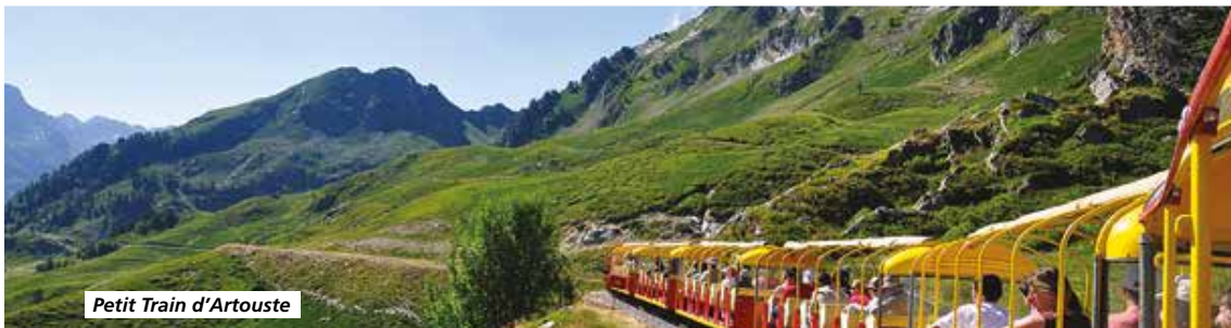
Petit Train d'Artouste