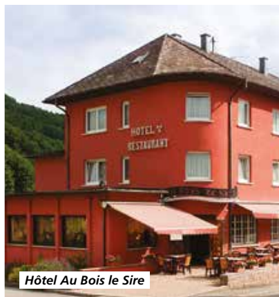
Hôtel Au Bois le Sire

Tarif par personne comprenant : le transport en autocar de Grand Tourisme, l'hébergement en hôtel 3*, la pension complète du petit-déjeuner du jour 1 au déjeuner du jour 6, boissons comprises, les visites et excursions prévues au programme, le guide-accompagnateur local, l'assurance rapatriement.