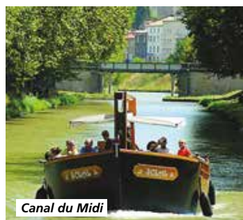
Canal du Midi

Route du retour. Arrêt déjeuner au restaurant. Poursuite vers votre région et arrivée chez vous en fin de journée.