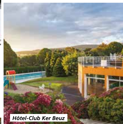
Hôtel-Club Ker Beuz

Tarif par personne comprenant : le transport en autocar de Grand Tourisme, l'hébergement en hôtel-club 4*, la pension complète du petit-déjeuner du jour 1 au déjeuner du jour 6, boissons comprises, les visites et excursions prévues au programme, l'animation en soirée, l'assurance rapatriement.